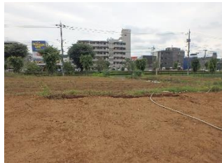
取得した八王子の土地

東京西営業所の転居用地として、東京都八王子市に 393 坪の土地を取得しました。現在の町田市の事務所から近い土地で、都心よりになるのですが、住所としては八王子市になります。2004(平成16)年7月に現在の事務所に転居して、その後に道路を挟んで向かい側の土地を取得して 2014(平成 26)年4月に資材倉庫が追加されました。当初は、東京営業所という名称だったのですが、東京中央営業所が出来て、東京西営業所になりました。その事務所も手狭になってきて、また、周辺に大型店舗がどんどんできて道路混雑が激しくなり、また交通量の多い道路の向かい側に倉庫があることなどもあり、転居用地を探していたところ、立地、広さ、周辺状況なども適した土地が見つかり、取得することができました。鉄骨3階建ての倉庫兼事務所をこれから建設して、来年(2024年、令和6年)の秋に完成予定で、来年中には転居予定です。たまたまですが、丁度 10 年ごとの大きな節目になりそうです。