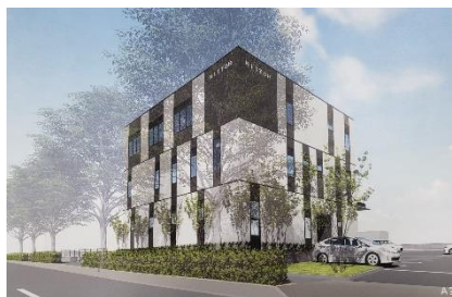
東京西営業所完成予想