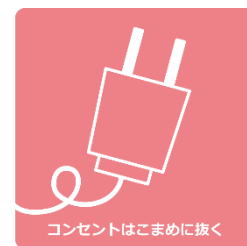
コンセントはこまめに抜く