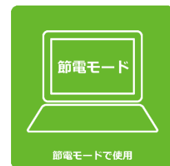
節電モードで使用