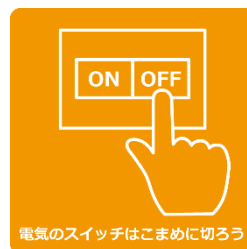
電気のスイッチはこまめに切ろう

電気代が上がってきています。パソコン等の待機電力の削減、こまめな消灯、大変暑い日が続いていますが、無駄なエアコンの OFF など、節電に努めましょう。コロナ感染も5類となり落ち着きをみせていますので、今まで感染予防のため換気重視で、ドアや窓を開放してのエアコン稼働が通常となっていました。今後は効率重視で、コロナ前に戻してドア等閉じた状態で業務にあたります。