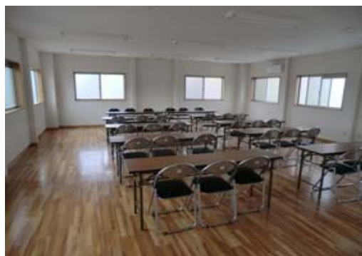
東京倉庫 2階会議室