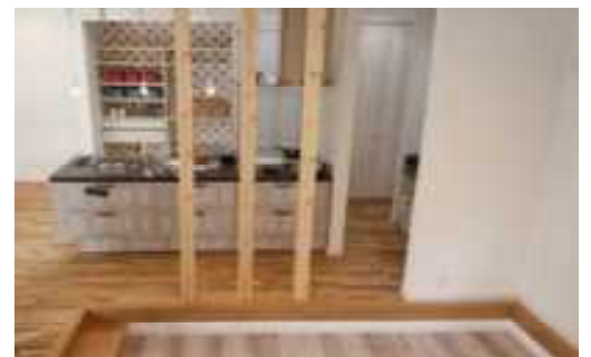
リビングとキッチン