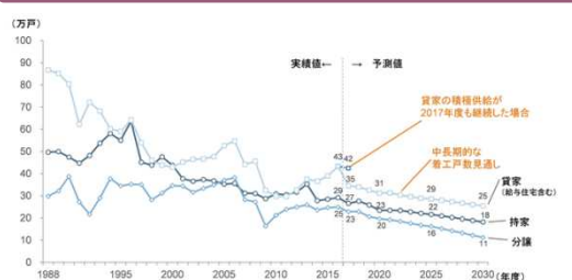
図2：新設住宅着工戸数の実績と予測結果(利用関係別)