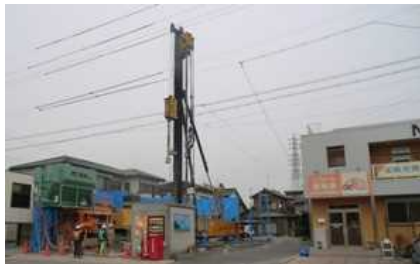
三河営業所建設開始

1月8日に三河営業所・倉庫新築工事の地鎮祭が執り行われました。雨模様の天気でしたが、弊社6名と施工関係の皆様11名の総勢17名が出席し、地元にある上地八幡宮の宮司様に来ていただき、厳かに行われました。2月に入り、いよいよ工事が着工しました。