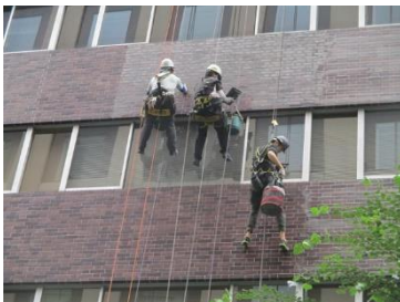
東京・銀座の現場