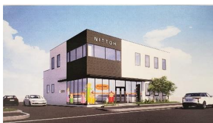
新岐阜営業所完成予想図

コロナで、工事の進捗が心配されましたが、工事は工程通りで進んでおり、9月4日に鉄骨建方予定です。太陽光発電と蓄電池が設置され、駐車場も緑化されるなど、環境にやさしい事務所になります。12月中旬に新事務所に転居予定で、調整中。新しい住所、電話番号も決まっていますので、来年以降にも使用する書類等の印刷は、ご配慮下さい。