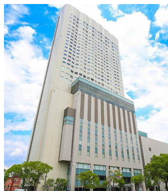
ANA クラウンプラザホテル グランコート名古屋

当日は、当社の「50年の歩み」を振り返る映像を用意しています。その他の難しい式典は一切ありませんので、皆さん楽しみにお越しください。